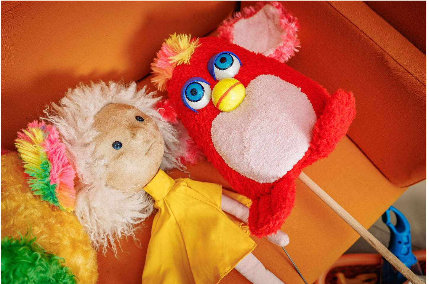
Kleurrijke figuren spelen in 'Amai Speciaal Chapeau' een hoofdrol.

“Dat is voor ons drieën ook de droomwereld waarin we onze dochter willen laten opgroeien”, vult Karliën aan. “We hebben dit verhaal in de eerste plaats voor onze dochter geschreven, maar alle kinderen van drie en ouder, zelfs volwassenen, gaan er plezier aan beleven. We hebben ervoor gezorgd dat er geregeld gelachen kan worden, want anders gaat het bij driejarigen snel vervelen. Het tot leven brengen van figuren is het hoofdingrediënt in het verhaal en dat blijft kinderen altijd boeien.”